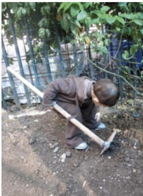
Tuinman in de dop

Het is moeilijk voor de school om het hoofd financieel boven water te houden. Wel kregen zij in 2009 een (deels)