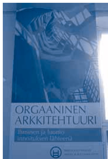
"Organische Architectuur" in Tampere, Finland