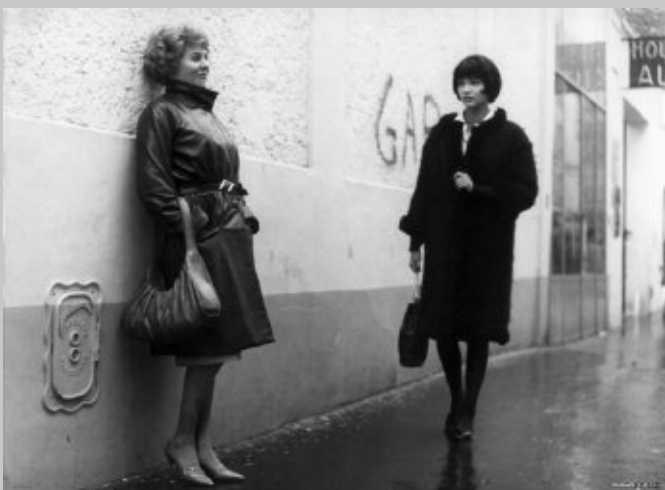
Filmbeelden, een weergave van een voorgegeven realiteit?

Het is tevens een oord van transparantie, want doorheen het beeld spreekt een werkelijkheid die groter is dan het beeld zelf, waardoor het beeld 'doorlaatbaar' wordt.